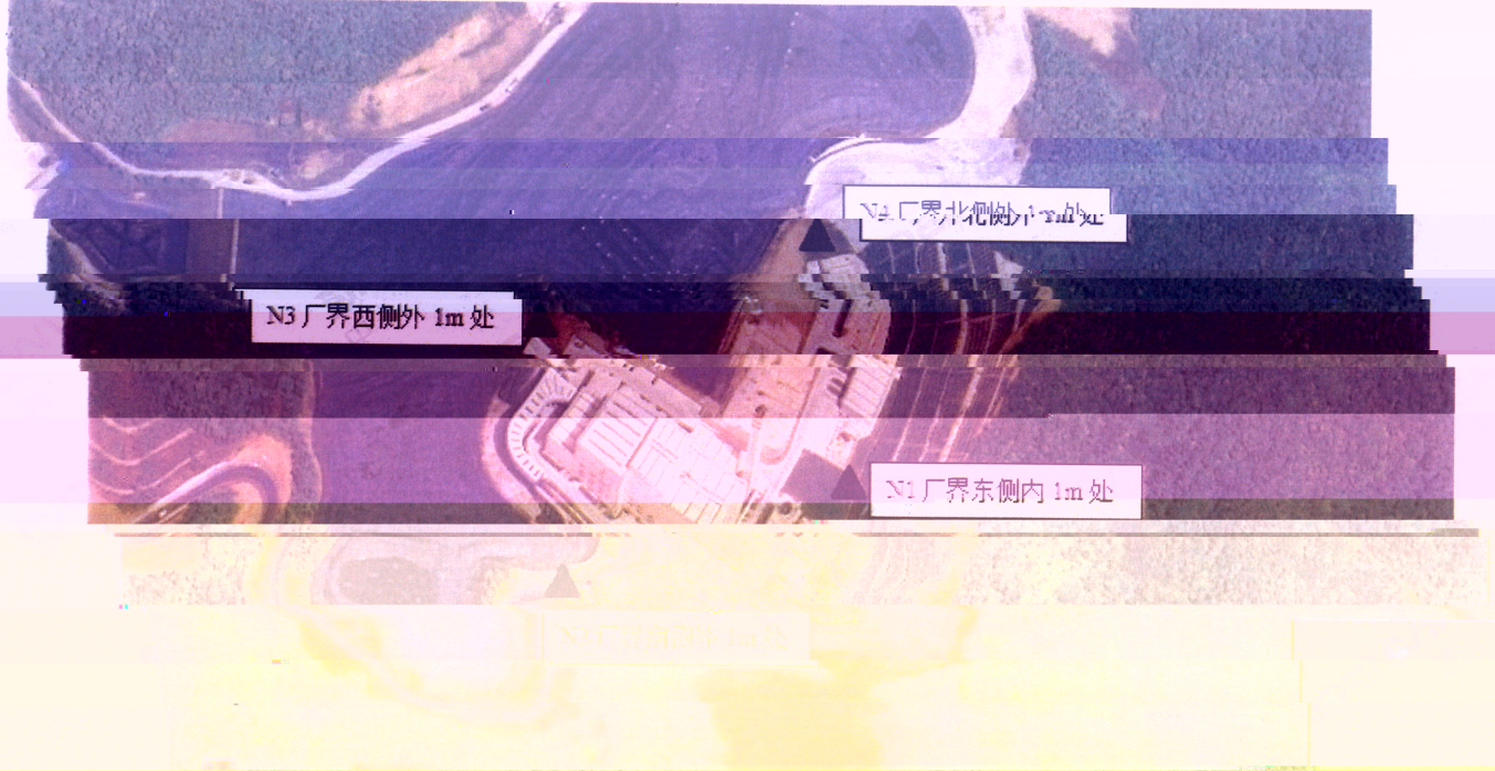
附图 1: 采样点位示意图