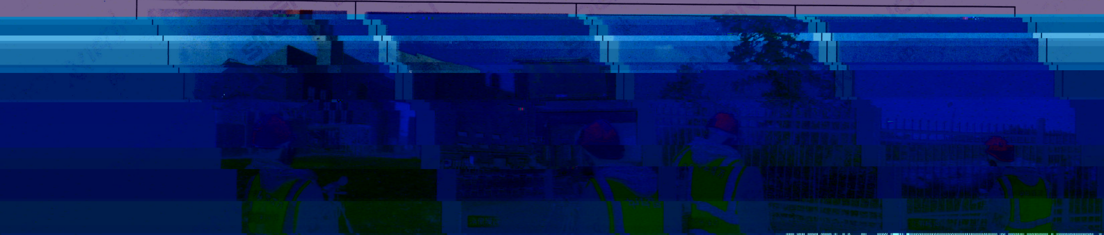
附图 2: 采样照片