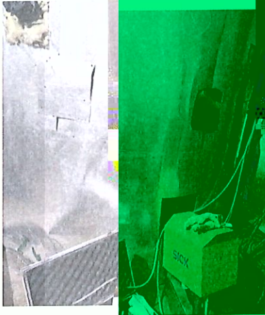
D A002(2#排气筒) (C)